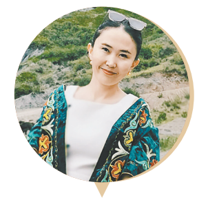
阿依努尔·吐马别克

1954 年生于新疆霍城，哈萨克族，著名作家、翻译家，中国作家协会影视文学委员会副主任，中国电影文学学会常务副会长，《中国作家》原主编。